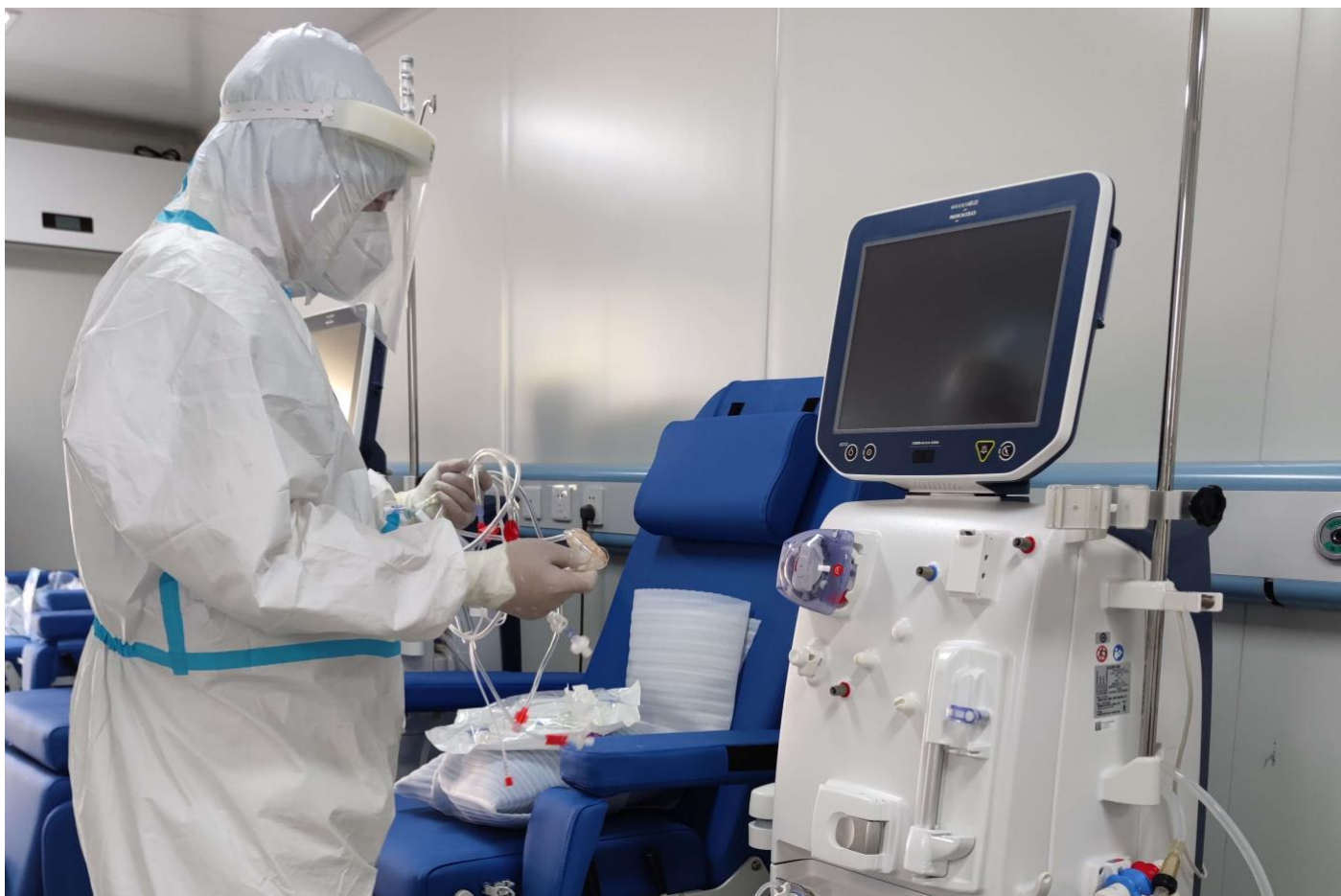
威高日机装的工作人员在方舱式紧急透析室中进行装置维护（2022年9月）