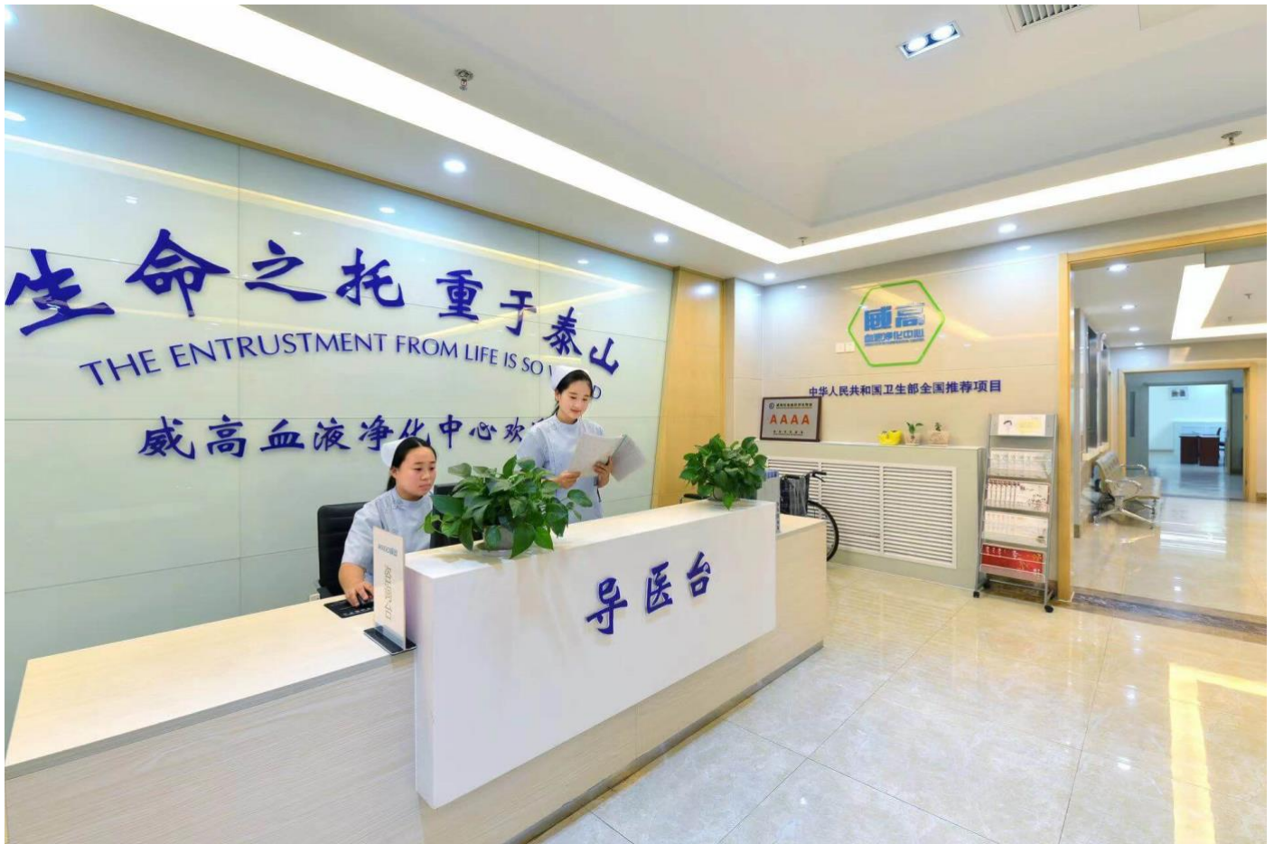
威高血液净化运营的威高透析中心